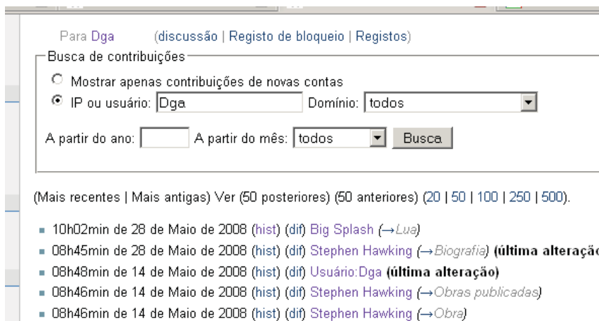
FIGURA 1 – Levantamento das contribuições do aluno Dga à Wikipédia.

Para poder participar dessas atividades, cada aluno, ao início do semestre, teve de criar sua conta de usuário na Wikipédia. De posse dos nomes de usuário, a Wikipédia provê um recurso de pesquisa às contribuições de cada um, permitindo ao docente monitorar as contribuições de cada aluno, como se vê na Figura 1 (a figura foi editada por forma a garantir a confidencialidade do aluno).